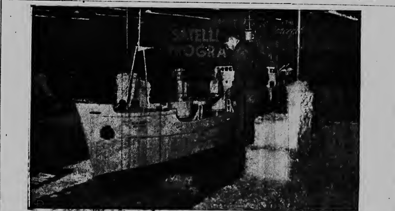
De laatste werkzaamheden worden gedaan aan een van de boten, welke meereiden in de Inauguratie-parade in de V.S. Er waren in totaal 48 boten vertegenwoordigende alle 48 Staten.

ROTTERDAM. — In een vergadering van het bestuur van het Koninklijk Nederlandsch Gymnastiek Verbond te Rotterdam is besloten dat Nederland niet zal deelnemen aan de tweede gymnastriade welke in de eerste helft van juli dit jaar te Zagreb wordt gehouden. Dit besluit werd genomen in verband met de onzekere internationale politieke omstandigheden en in onderling overleg met de betrokken verenigingen.